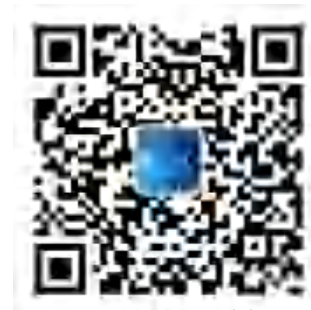
江苏海矽美 微信公众号